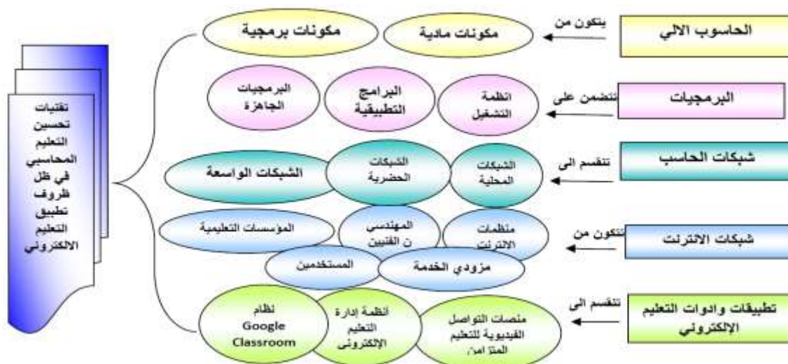
الشكل (1): تقنيات تحسين التعليم الإلكتروني